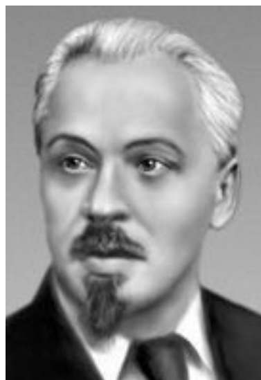
Рис. 3. I Соловьев Зиновий Петрович 1876 – 1928

В этот период были разработаны материалы для принятия решений по организации медицинской помощи населению, по подготовке нормативно-правовых документов, по строительству, организации деятельности лечебных учреждений, подготовке медицинских кадров и проведению научных исследований в этой области [2]. Проведенные исследования показали связь показателей физического развития детей и их здоровья с социально-гигиеническими факторами.