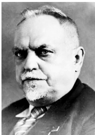
Рис. 2. I Семашко Николай Александрович 1874 – 1949

В 1920–1930-е годы роль кафедры социальной гигиены Второго МГУ была особенно значима в развитии профилактического направления работы органов здравоохранения. Деятельность кафедры в этот период была направлена на усиление профилактической подготовки врачебных кадров [4–6].