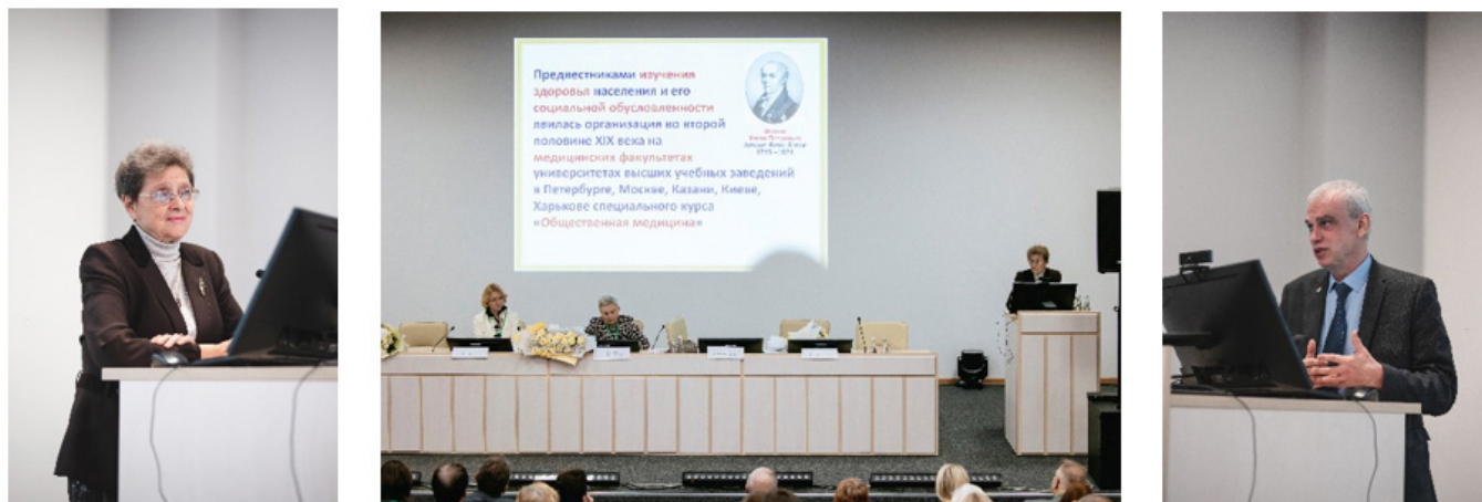
Рис. 12. I Всероссийская конференция, посвященная 100-летию кафедры. 23 ноября 2023 г.

Итогом учебно-методической, педагогической и научно-исследовательской работы кафедры являются многочисленные учебные программы, курсы лекций, учебники и учебные пособия для студентов лечебного, педиатрического и стоматологического факультетов, ординаторов, аспирантов, преподавателей, врачей, специалистов практического здравоохранения. Кафедрой ведется постоянная работа по оказанию содействия органам здравоохранения в решении актуальных проблем организации медицинской помощи населению и профилактики нарушений здоровья путем ориентации населения на здоровый образ жизни [1].