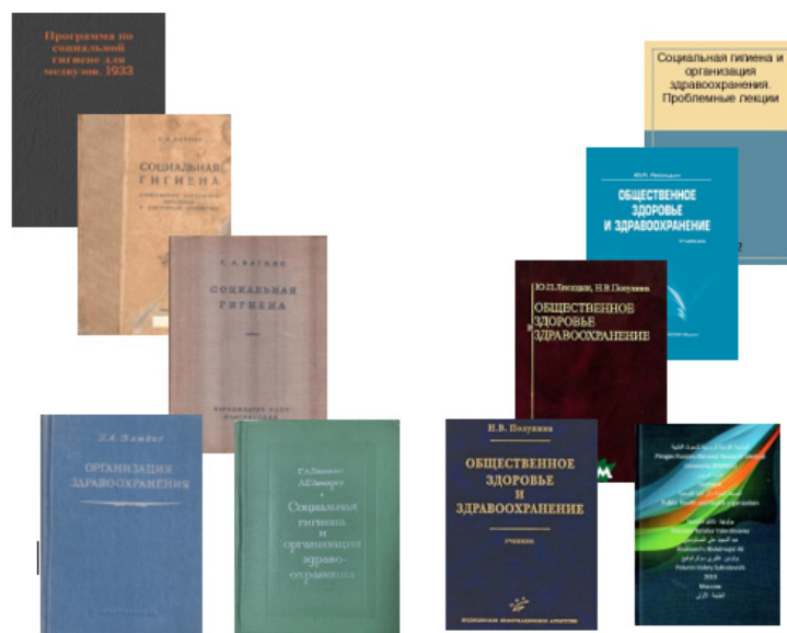
Рис. 6. | Баткис Г.А. и Лекарев Л.Г.

Учебники для студентов, изданные на кафедре [9-16].