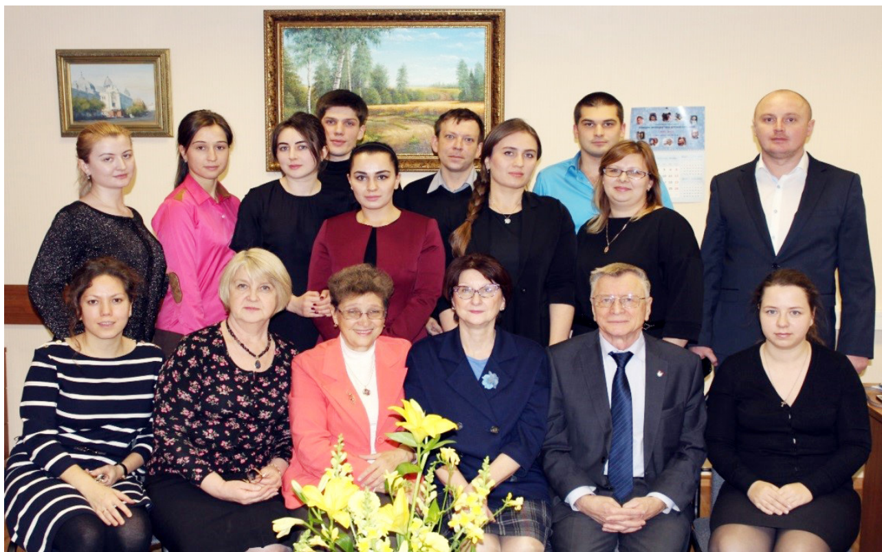
Рис. 11. Кафедра и сегодня мощный коллектив единомышленников.

3.2.3. «Общественное здоровье, организация и социология здравоохранения, медико-социальная экспертиза» и 3.2.1. «Гигиена».