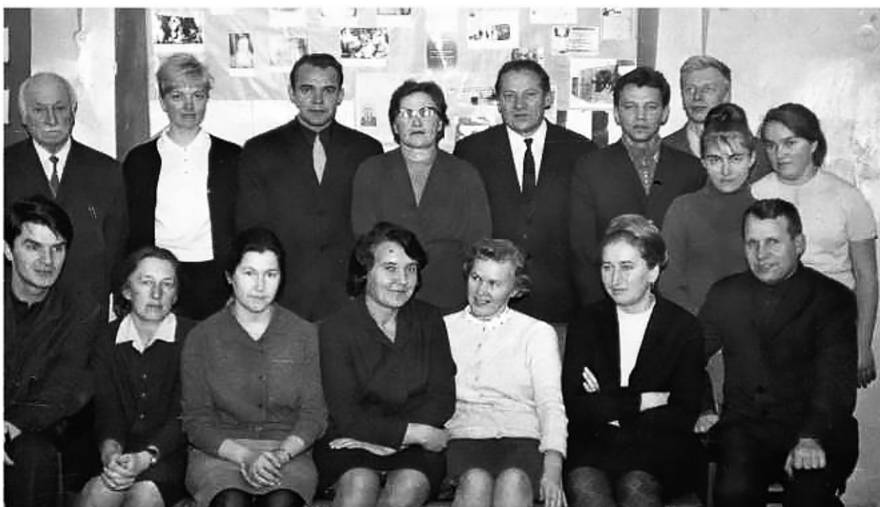
Рис. 8. I Коллектив кафедры, 1969 год.

Научной школой под руководством академика Ю.П. Лисицына разработана и обоснована концепция воздействия на здоровье факторов образа жизни, согласно которой здоровье человека рассматривается с позиции единства его социальной и биологической природы. Также, было доказано, что здоровье индивидуума более чем на 50% определяется факторами образа жизни. Данная концепция внесла значительный вклад в теорию и практику профилактической работы [7, 1].