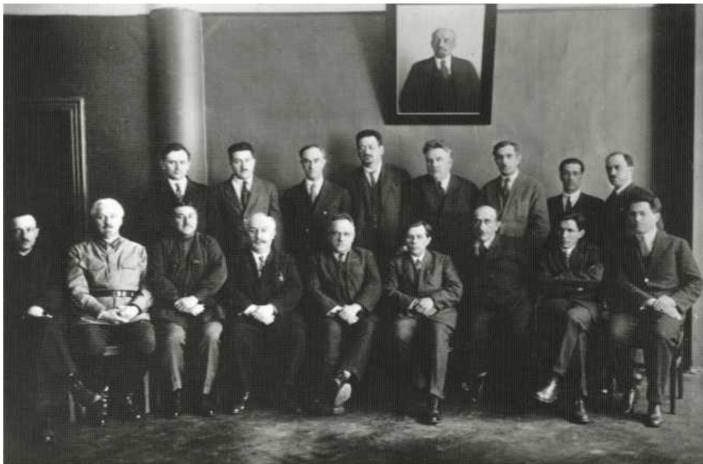
Рис. 1. | З.П. Соловьев и Н.А. Семашко с сотрудниками кафедры, 1922-1923 годы

федры социальной гигиены, и 11 марта 1924 года нарком здравоохранения Н.А. Семашко подписал приказ об организации самостоятельной кафедры социальной гигиены во 2-м МГУ. Возглавил кафедру Зиновий Петрович Соловьев, который одно-временно являлся заместителем наркома здравоохранения РСФСР [2, 3].