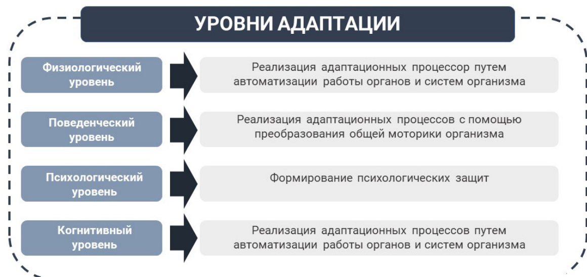
Рис. 2. | Уровни адаптации студентов, Сидоров К.Р.

В последние годы широко изучаются вопросы, связанные с возможностью дистанционного обучения студентов медицинских университетов. Так в исследованиях Е.Г. Петровой отмечено, что психоэмоциональное состояние студентов, получающих знания в дистанционном формате обучения, характеризуется повышением ситуативной тревожности, снижением адаптации к учебному процессу [25].