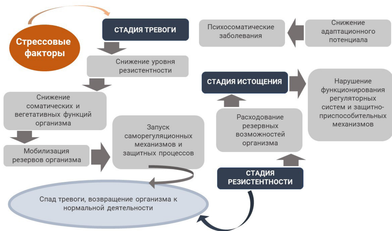
Рис. 1. | Схема адаптационного синдрома Г. Селье

Для рассмотрения адаптации студентов к обучению целесообразно описать понятие стресса, как совокупности неспецифических психофизиологических реакций организма, возникающих на воздействие стрессовых факторов. Понятие адаптационного синдрома было введено Г. Селье (рис. 1), которое включает в себя три стадии: тревоги, сопротивления, истощения [33].